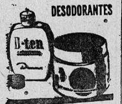
DESODORANTES REGULA LA TRANSPIRACION DE LAS AXILAS Y LAS DESODORIZA POR VARIOS DIAS

NO NOS IMPORTA: — "Algunos organismos autónomos estatales así como algunas agencias publicitarias, casas comerciales y asociaciones, niegan su anuncio a este periódico por campañas que en contra de sus disposiciones, medidas, actuaciones, etc. hemos hechas. Así nos importa, nos complace, porque nuestra manera de actuar se inspirará siempre en lo que conviene a los intereses de nuestros lectores y no a los propios. Es decir que jamás atenderemos nuestra propia conveniencia a la sinceridad y honestidad que debe regir la vida de un periódico. Si por nuestro amor a la verdad, si por decir lo que creemos o sentimos justo, si por ser sinceros, se nos niega, en plan "castigador" en el anuncio.